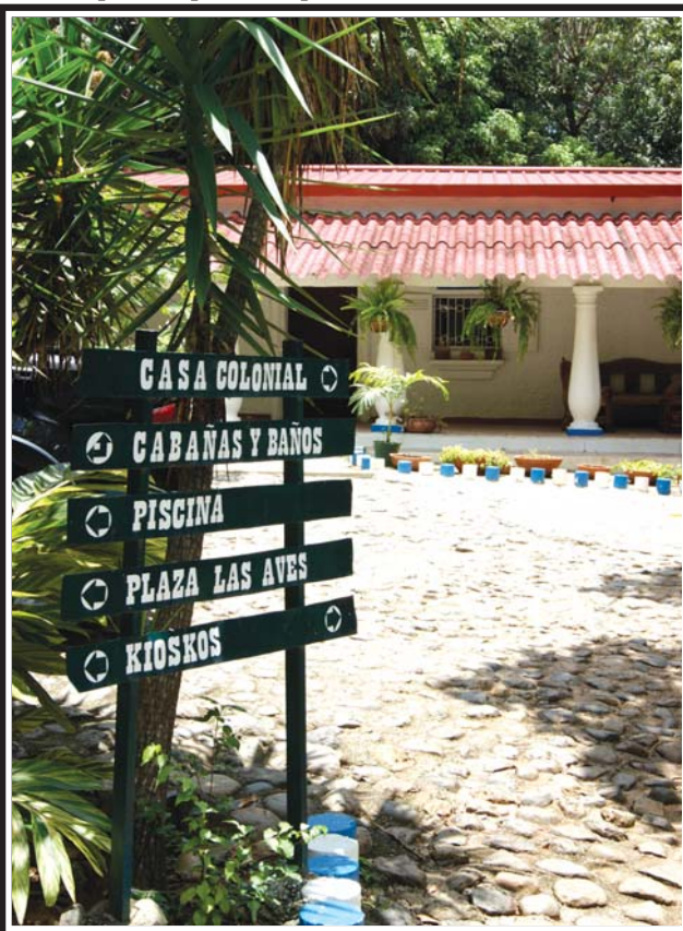
Hacienda Beraca lugar de encuentros, retiros y formación de liderazgo de la Federación CCN.