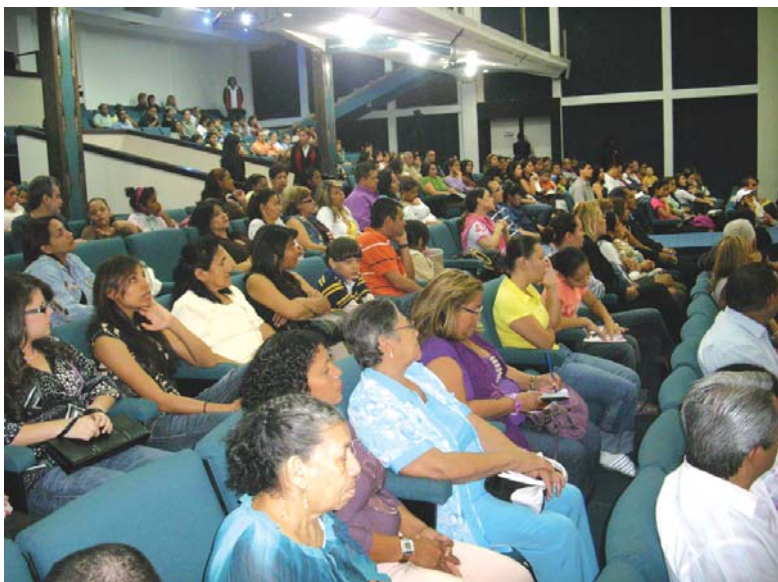
La iglesia MIREs realiza 5 servicios los días domingos.

Cuando la mujer se levanta y toma el lugar correcto, y no es una mujer que tiene amargura y celos hacia con la congregación, sino que es una mujer sana espiritualmente, la gente ve eso y ese es un espíritu que se mueve dentro de la iglesia y comenzamos a adoptar mujeres con corazones como Dios realmente las quiere, sujetas a su marido y a Dios.