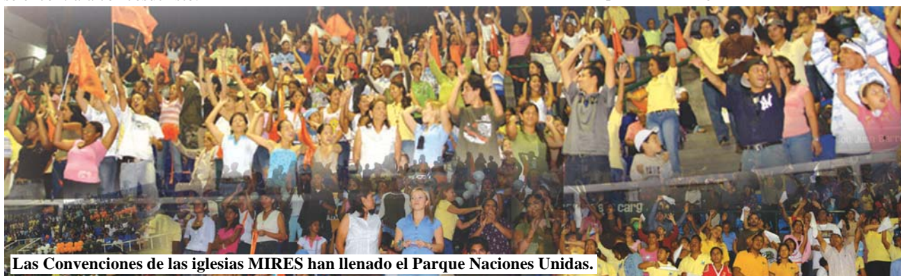
Las Convenciones de las iglesias MIREs han llenado el Parque Naciones Unidas.